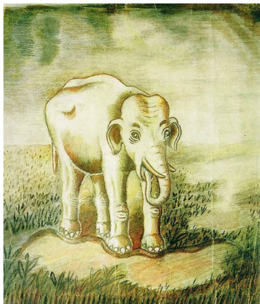
Рис. 3. И. Селиванов. Слон