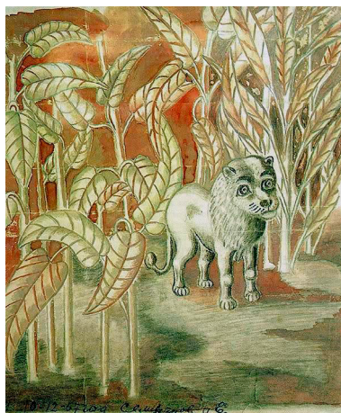
Рис. 2. И. Селиванов. Лев

Изучая облик конкретных живых существ, домашних и диких животных и птиц (собаки, петуха и кур, кот, лошади, коровы, льва, лани, слона), написанных «с любовью и со знанием «характеров» [Никонова, 2007, с. 147], Л.А. Никонова обращает пристальное внимание на глаза: «У них большие удивленные глаза, полные восхищения: их радует и изумляет окружающий Божий мир. <...> И одновременно в глазах животного видна какая-то “философская” глубина, умудренность жизнью, человеческая мысль! <...> Селиванов так любовно относился ко всякой живности, что нередко сравнивал ее с человеком, наделял ее человеческими свойствами и разумным выражением глаз. И этим особенно привлекательно его творчество. Зритель как бы ловит на себе вопросительные или задумчивые взгляды его спокойно-добрых или грустно-мечтательных созданий и не может не отозваться...» [Никонова, 2007, с. 147–148].