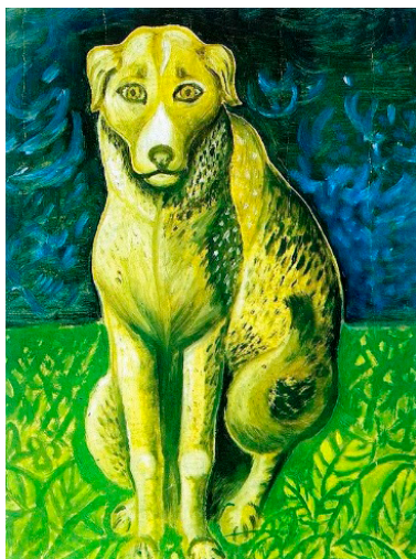
Рис. 4. И. Селиванов. Собака