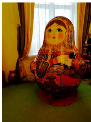
На фото: Экспонат музейно-туристического центра «Золотая Хохлома» (г. Семёнов)