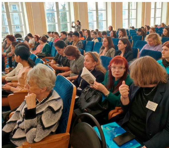
На фото: Пленарное заседание конференции