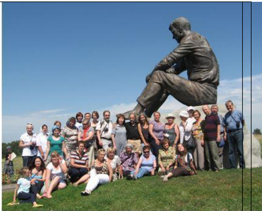
У памятника В.М. Шукшину (с. Сростки, лето, 2014)