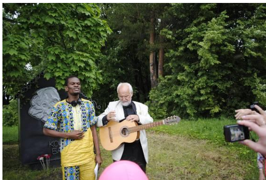
поэт поют Бальмонта в Гумнищах

В завершение праздника все желающие отправились на автобусах в Гумнищи, где родился поэт, в Якиманну и Дроздово, где жили и упокоились его предки. К памятному знаку в Гумнищах были возложены цветы. На могилах родителей в Якиманне священник храма Казанской Божией Матери, в котором в 1867 г. крестили новорождённого Константина и нарекли его именем деда, отслужил панихиду. А в небо над усадебным парком улетели воздушные шары – гости праздника загадали желание непременно встретиться в Шуе в июне 2017 г. на юбилейных торжествах в честь 150-летия со дня рождения К. Бальмонта.