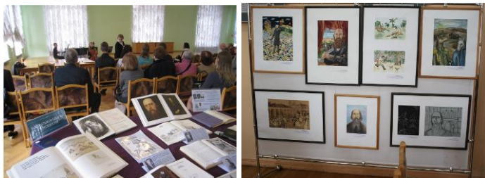
Выступают студенты Тверского музыкального колледжа им. М.П. Мусоргского.

М.Е. Салтыков-Щедрин в работах воспитанников изостудий «Зебра» и «Колибри».