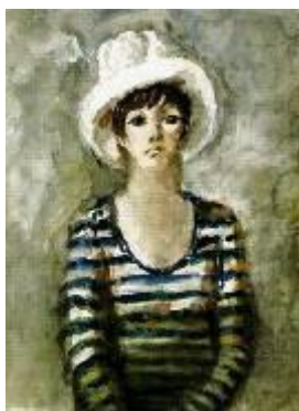
Акварельный портрет Беллы Ахмадулиной работы Бориса Мессерера.

Самым гармоничным из всех возможным финальных аккордов конференции стало «Музыкальное приношение Белле» – фортепианный концерт в исполнении пианиста Алексея Гориболя и