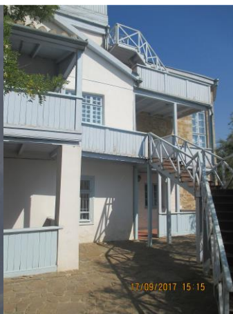
Дом поэта в Коктебеле